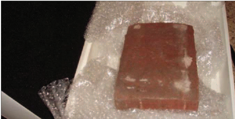
Il classico "pacco" con un mattone confezionato con della carta da imballaggio. A sinistra un agente della Polizia Postale