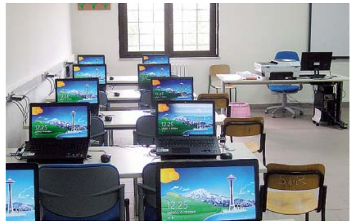
COMPUTER A SCUOLA Al Liceo Scientifico «Pier Paolo Pasolini» di Potenza il nuovo laboratorio di informatica

Entrambi serviranno anche per lezioni di matematica ed inglese, così come l'altro presente nel Plesso Distaccato di Laurenzana; ad essi vanno sommati i laboratori di chimica e di fisica già esistenti per una proposta formativa sempre più qualificata. «Tutto ciò contribuisce a far salire notevolmente la portata dell'offerta formativa della nostra scuola in sintonia con le linee guida della recente riforma - conferma il dirigente del Liceo «Pasolini» prof. Gio-