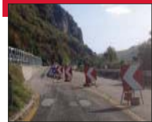
Una delle interruzioni sulla Basentana

Viaggio sulla Basentana Un lunghissimo percorso a ostacoli