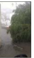
Pioggia a Pisticci