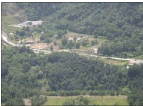
La Bretella di Lauria

Tutte le zone della Basilicata coperte dall'accordo di programma quadro