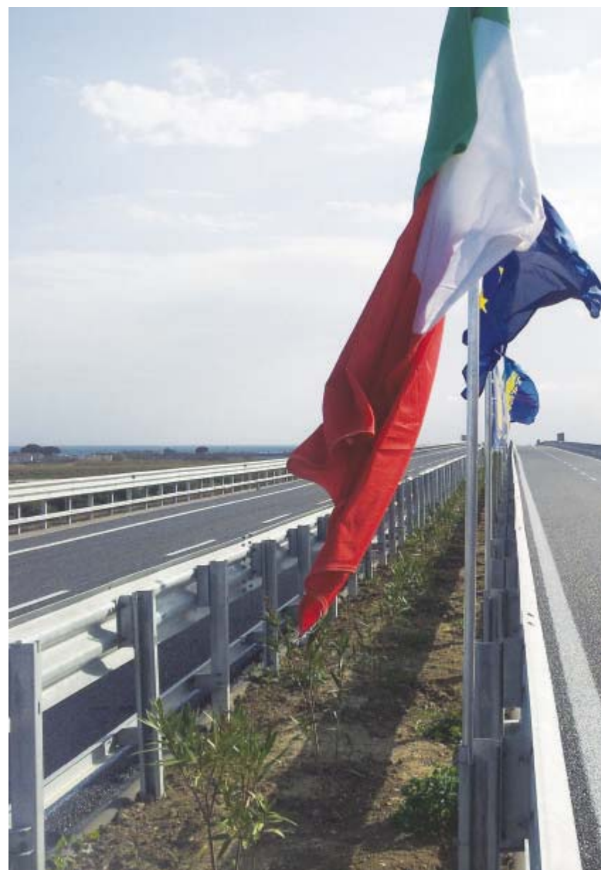
La variante di Nova Siri

Dagli interventi sulla viabilità, alle riqualificazioni urbane